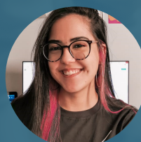
Sara Mendes do Nascimento Diagramação e arte