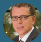
Presidente Laércio Cosentino TOTVS